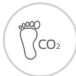
Reduzierter CO 2 -Fußabdruck