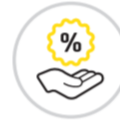
Positiver wirtschaftlicher Effekt