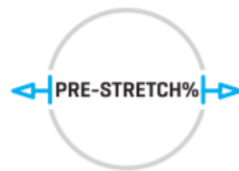
Dehnbarkeit bis zu 250 %.